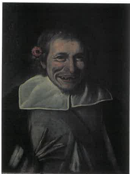
Goyas berømte maleri, Den Gale

I guldsalen, der har fået navn efter det gamle gyldenlædertapet, ser man overfor indgangen et maleri af greve Oberbeck-Clausen i malteseruniform (Morintreu 1959). Til venstre for indgangen fra galleriet en stor skænk fremstillet af den franske hofsnedker Riesener (Louis XVI). I Versailles og