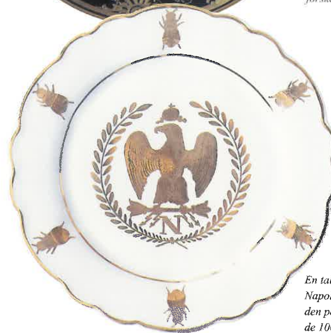
En tallerken fra det stel Napoleon I lod fremstille i den periode, der kendes som de 100 dage