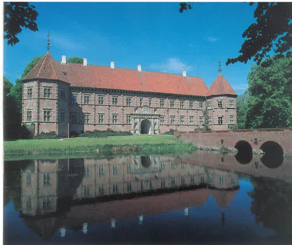
Voergård er omgivet af Danmarks bredeste voldgrav

Allerede i Karen Krabbes tid blev der bygget til det oprindelige stenhus, men sammen med forskellige udbygninger i bindingsværk kunne