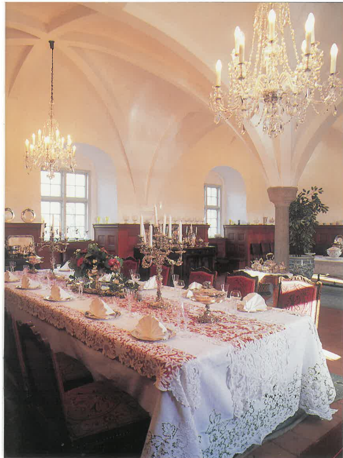
Spisebord i søjlehallen med krydshvælvinger

I forstuen til tårnværelset har man nu indrettet bibliotek. I tårnværelset, der også betegnes som spøgelsesværelset, ses et meget smukt Louis XVI chatol. Tårnværelset var Ingeborg Skeels private gemak, og trods righoldige historier om spøgeri netop på dette sted indrettede Voergårds sidste ejer også sit private opholdsrum her. Spøgeriet optræder hovedsagelig som et bestemt, kraftigt bankesignal, der også er hørt i det andet tårn, og lyden lader sig indtil videre ikke forklare. I rummet er opstillet en videoskærm, der viser grevindens smykker, som er i familiefondens eje, men som opbevares i en bankboks. En brilliantring på 26 karat har