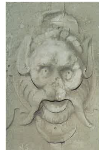
Detalje fra portalen

Voergård havde i hoveriets tid ikke den bedste klang i fæstebøndernes ører, for gården var for dem ensbetydende med arbejde og forpligtelser. Var nogen opsætsig, kunne der trues med indsættelse i "Rosedonten", et umenneskeligt fangehul i den ældste del af Voergård anvendt i bisp-ernes tid. Et trangt og totalt mørkt hul i hvilket en mand ikke kunne stå oprejst, og når lemmen blev sat for og sikret med en skydebjælke, har der været ulideligt iltfattigt. En lav port omtrent midt i nordfløjen fører ned til den kælder, hvor Rosedonten findes til venstre set fra gården. Til højre for porten i østfløjen er der nedgang til vagtstuen, der på nok så human måde også kunne bruges til afstraffelse af bønder, der forsømt hoveripligten. På dette område adskilte Voergård sig imidlertid ikke fra