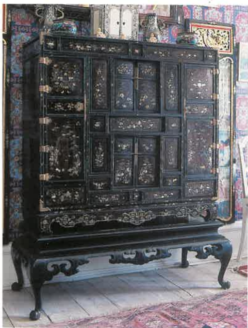
Et gammelt kinesisk møbel med perlemorsdekorationer. Hvert enkelt lille motiv er et kunstværk

tilhørt kejserinde Eugénie (1826-1920). I visse franske kredse var smykkerne et absolut statussymbol, og grevinden kunne en gang ikke gå med sin niece i operaen i Paris, for hun havde ikke sine juveler med, og alle, der kendte hende, ville tro, at familien var på falittens rand, hvis hun gik i operaen uden smykker. I galleriet, der forbinder riddersalen med en række gæsteværelser i renæssancefløjen, findes på alle vægge smukke malerier og historiske dokumenter. I værelserne hænger flamske gobeliner, og der er smukke, orientalske tæpper på gulvene – flere af disse tæpper er meget gamle. De vigtigste værelser er det kinesiske værelse, kaldet således på grund af de antikke kinesiske møbler og kunstgenstande, og man må navnlig bemærke de smukke perlemorindlagte dekorationer på