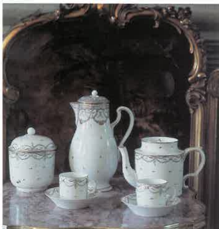
Dele af det stel, som blev benyttet af Marie Antoinette og Louis XVI under fængslingen i Temple