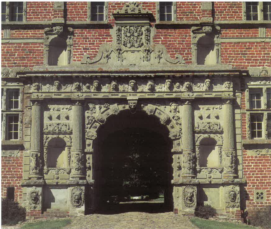
Sandstensportalen i slottets østfløj

den nuværende nordfløj ikke siges at være en hverken smuk eller statelig bygning. Da Ingeborg Skeel yderligere havde forøget sit gods og desuden havde indtægter fra kramboder og meget andet, var hun særdeles velsitueret, så hun tog ikke i betænkning at opføre en ny hovedbygning i forbindelse med det gamle stenhus.