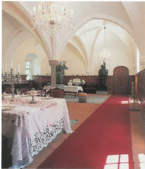
Slottets spisesal med krydshvælvinger