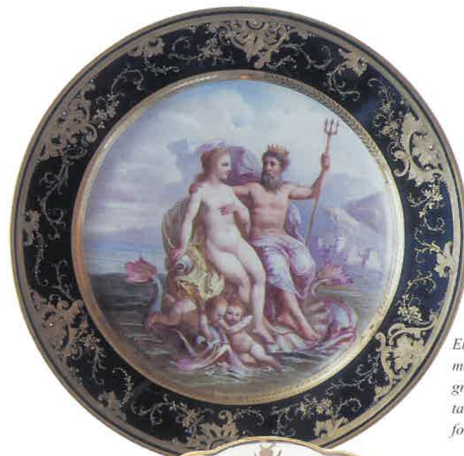
En af de 24 tallerkener med motiver fra den græske mytologi. Disse tallerkener er malet af forskellige kunstnere.