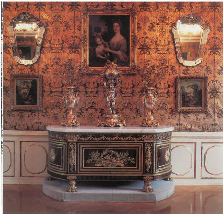
En Louis XVI skænk fremstillet af samtidens hofsnedker, Riesener, med bronzeornamenter af Gouttiers

på Louvre findes to lignende møbler. Bronzeornamenterne på skænken er af Gouttiers. Over skænken hænger et maleri af Largillière forestillende Louis den XV som barn. I samme stue et maleri af Greuze med titlen Melancolie og et maleri – sandsynligvis et forstudie – af Rubens forestillende Marie de Médicis. På væggen ud mod gården er et mandsportræt af Raphael Mengs, der også blev kaldt den tyske Raphael, og over dette et mandshoved af Frans Hals (1580-1666).