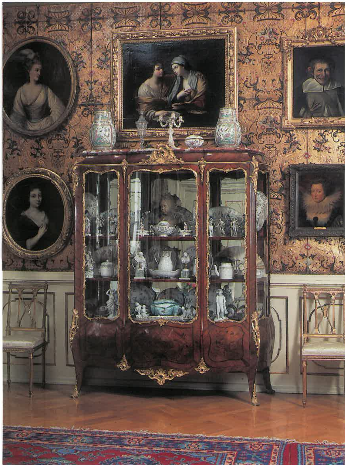
I vitrinen opbevares porcelænet fra Temple og kostbare antikviteter

Louis XVI-tiden. På spejlhylden står en af de fem replikas af Falconets statuette, La Baigneuse. I vitrinen ses glas fra det femtende århundrede og et sølvkrus, som professor Péan (grevindens far) efter en operation modtog som tak fra den russiske zar. På begge sider af det perlemorindlagte chatol står to meget smukke Delft-vaser. Skærmen foran kaminen har tilhørt Louis XIV – den er broderet af en af hans elskerinder og senere gemalinde, Mme de Maintenon. I tårnværelset – det tidligere bibliotek – ses en marmorbuste af professor Péan, der var en af Europas mest fremtrædende kirurger og opfinder af den særlige operationsklemme, der kaldes en pean. (Se glasmosaik på første sal i Maltserfløjen).