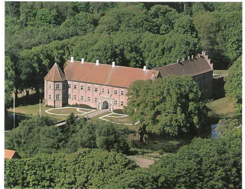
VOERGÅRD SLOT FLAUENSKJOLD 9330 DRONNINGLUND TLF. 98 86 71 08 http://voergaard.homepage.dk/