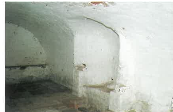
Fra østfløjens vagtstue der også kunne bruges som arrest

Efter Ingeborg Skeels død den 17. oktober 1604 kom hendes forudannelser til at slå til, da arvingernes første gerning var at få donationen til hospitalet i Sæby omstødt, skønt de fik næsten uanede rigdomme at råde over. Gårdens drift blev aldrig som i Ingeborg Skeels tid, og man tør næsten sige, at alt gik støt tilbage gennem flere århundreder. Ingen