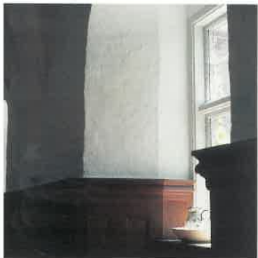
Indtryk af murenes dimensioner

Børglum bispedømmes befæstede hovedsæde omgivet af en solid ringmur og med vægtergange og skoldehuller – de sidstnævnte ses i tilmuret tilstand endnu på nordfløjen. Urolige tider var det for bisp Stygge Krumpen, for den katolske kirke havde til almindelig misfornøjelse underlagt sig store godser, og samtidig arbejdede reformatorerne mere og mere åbenlyst for at styrte den katolske kirke i Danmark. Børglum-bispen havde da også en stående hær på Voergård, som den katolske kirkes yderste fæstning, men efter sigende skulle denne styrke også forsvare ham mod slægt og familie til