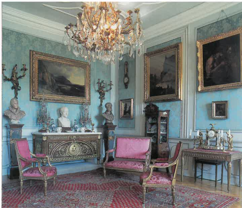
I Musiksalonen findes en mindre skænk ligeledes med bronzeornamenter af Gouttiers

kunstnerisk og historisk interesse. Det ene, der forestiller Marias og Josefs flugt til Ægypten, er fra det 16. og 17. århundrede og tilhørte oprindelig Vatikanstaten, men blev af pave Pius den IX sammen med andre gobeliner, der hænger i kirkesalen og i galleriet ved huskapellet, skænket til general Péan, der under den italienske frihedskrig forsvarede paven under dennes tilflugt i Engelsborg. De øvrige gobeliner hænger i riddersalen på 1. sal. De to buster af franske adelsmænd er udført af den kendte franske billedhugger Coysevox. De to stole er fra det 16. århundrede og stammer fra det hertugelige slot i Dreux vest for Paris. En sjælden, gammel brudekiste fra Spanien står midt for døren til stenstuen. I stenstuen, der ligger i den ældste del af slottet, finder man forskellige erindringer fra Napoleon III's tid. Et toiletmøbel med vandbeholder bærer vidne om beskedne hygiejniske forhold.