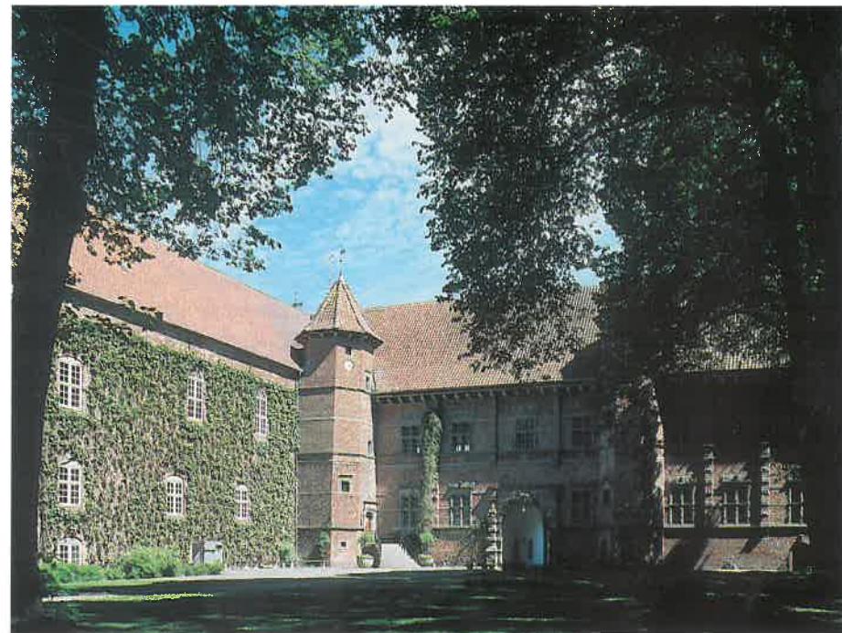
Nord- og østfløjen set inde fra gården

Beliggenheden er blevet valgt ud fra forsyningsmæssige og forsvarsmæssige begrundelser. Omliggende søer, enge og mosestrækninger har givet gode forsvarsmæssige betingelser, og samtidig gav søer og vandløb rigelig adgang til fisk – og ikke mindst ål – der havde stor ernæringsmæssig betydning. Siv og rør i søerne og træ i de omgivende skove var nødvendige bygningsmaterialer, en god jagt i skovene var