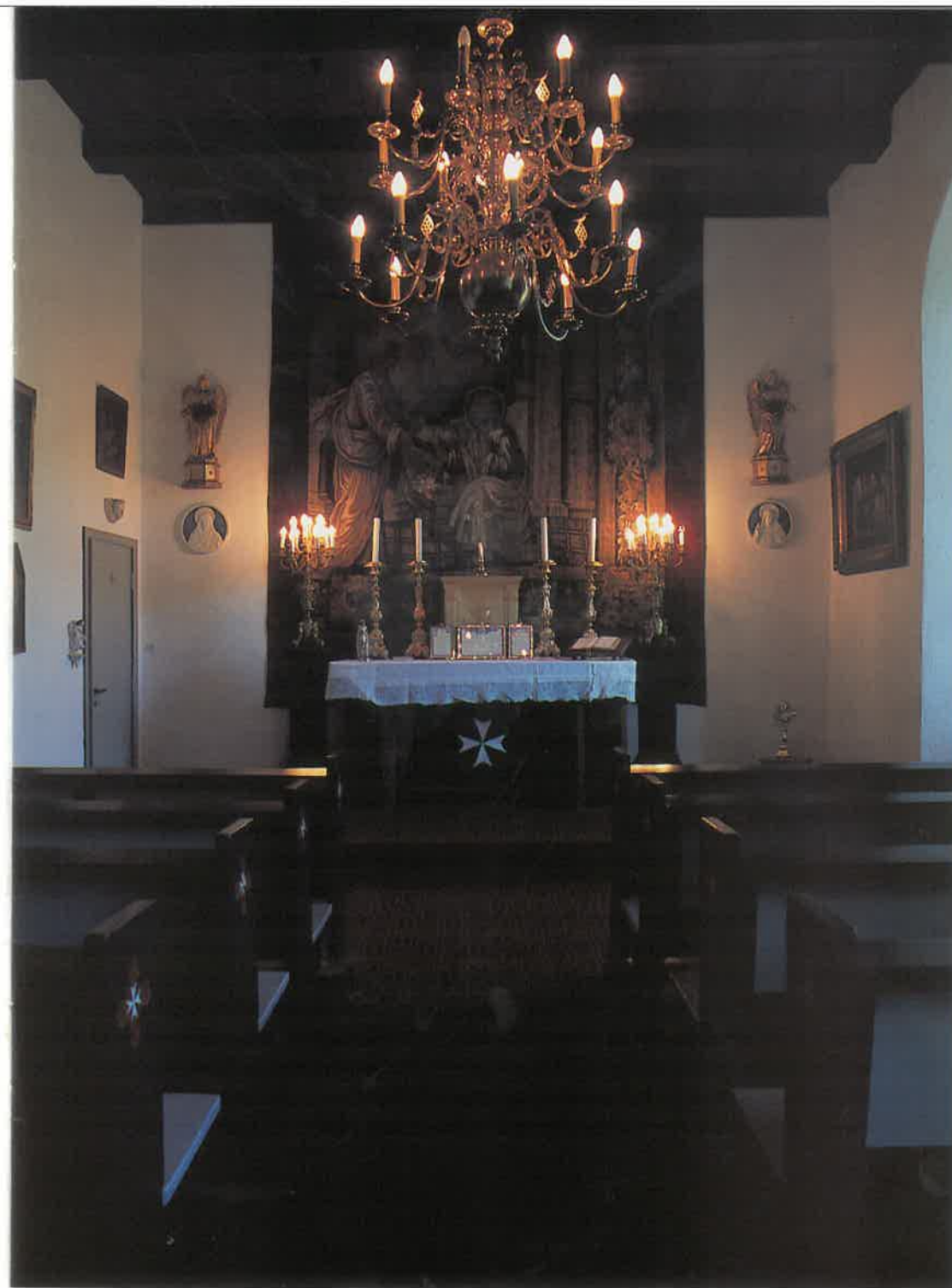
Aftenstemning i slottets kirkesal

Ingen af Ingeborg Skeels ugerninger lader sig på nogen måde dokumentere, men derimod kan det fastslås, at hun var en yderst godgørende dame, der skænkede midler til drift af et hospital i Sæby foruden almen velgørenhed. Hun lod også foretage omfattende restaureringer og tilbygninger til de kirker, der lå under hendes domæne. At hun dog har været en noget mistroisk dame, fremgår af indskriften på det epitafium hun lod opføre i Voer kirke over sin mand og sig selv, for hun tillægger ikke sine arvinger mange hæderlige tanker – hvilket hun måske heller ikke havde grund til. I sit gavebrev vedrørende hospitalet nævner hun ikke alene, at hun skænker den bygning, hun har ladet opføre til formålet, men også hvad hun og hendes arvinger hvert år skal yde i form af naturalier, og denne ordning har arvingerne ikke været tilfredse med.