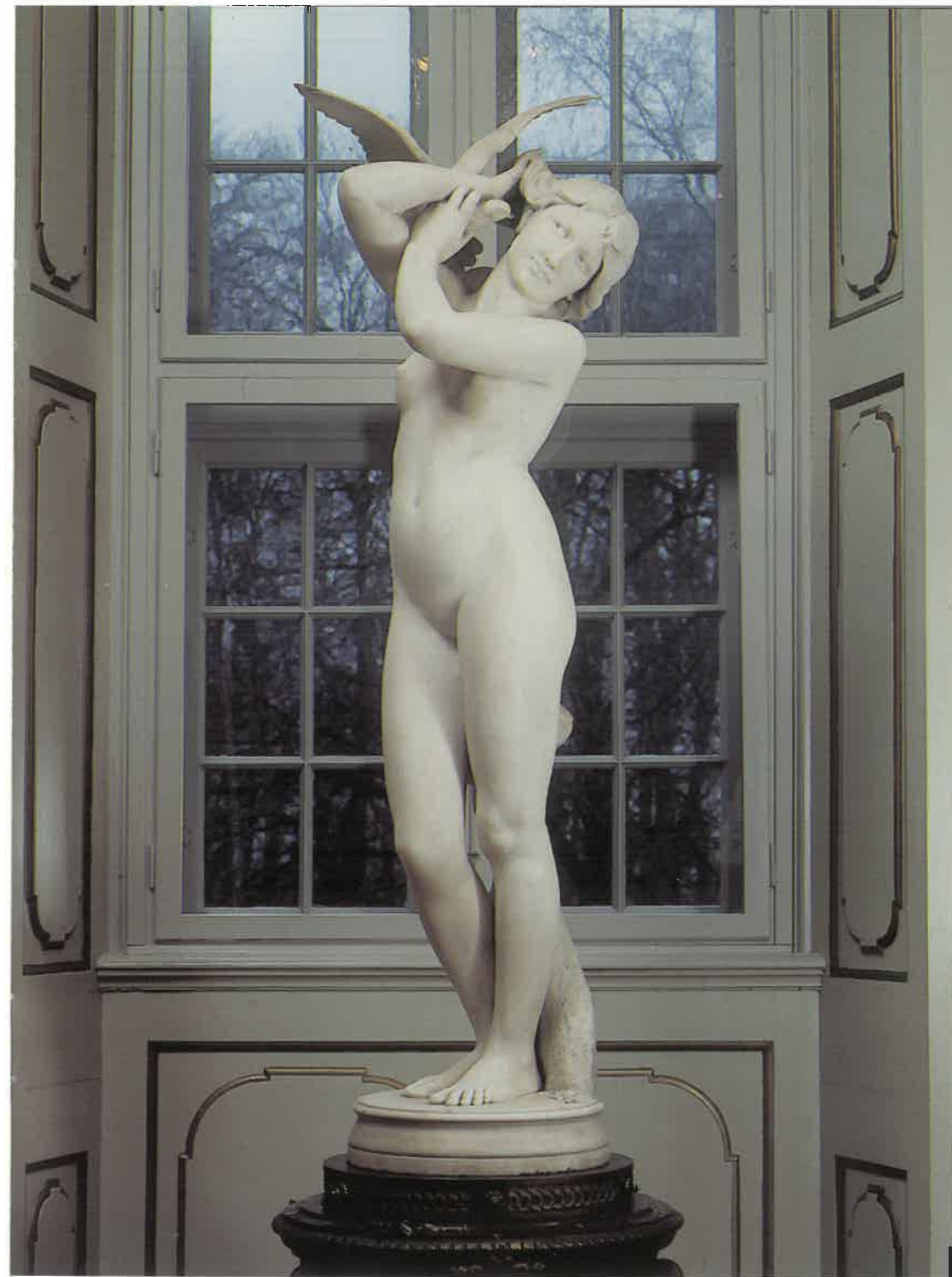
Delaplanches, Kærlighedens Budbringer

I riddersalen hænger på den ene endevæg en stor flamsk gobelin med motiv fra den skønne Helenes bortførelse. Stolene under denne gobelin er tidlig Louis XV. Malerierne på væggen er af Watteau, hvert enkelt indgik som dekoration på et skærmbret opstillet i Versailles, da toiletforholdene blev for sparsomme til de store selskaber – man kan