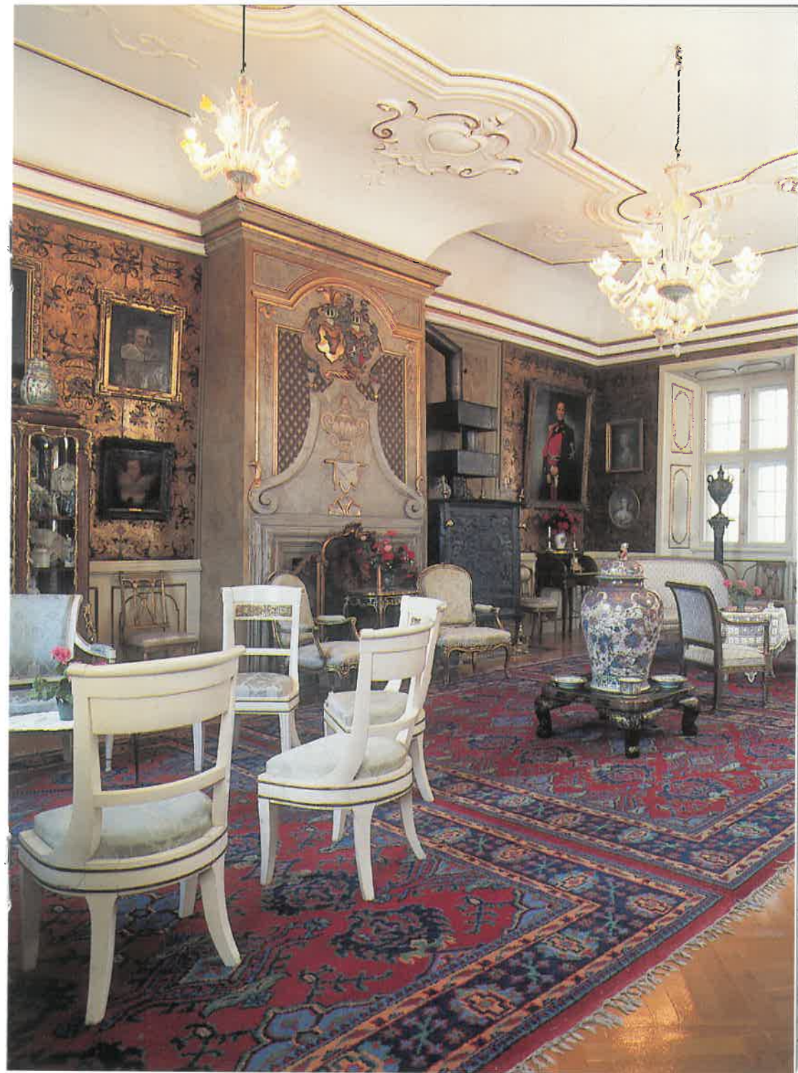
Guldstuen (oprindelig slottets fruerstue) med antikke møbler og malerier af Goya, Rubens, Rafael, Greuze m.fl.