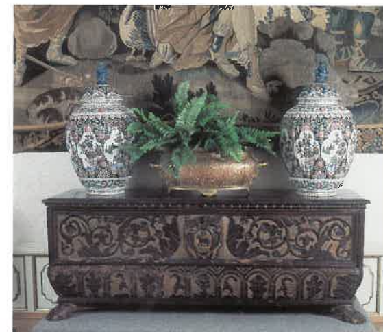
Spansk brudekiste med to antikke Delft-vaser

For enden af galleriet i østfløjen står Delaplanches berømte marmorstatue, Kærlighedens Budbringer – en kopi i bronze står på Glyptoteket i København. På væggen hænger flamske gobeliner af både