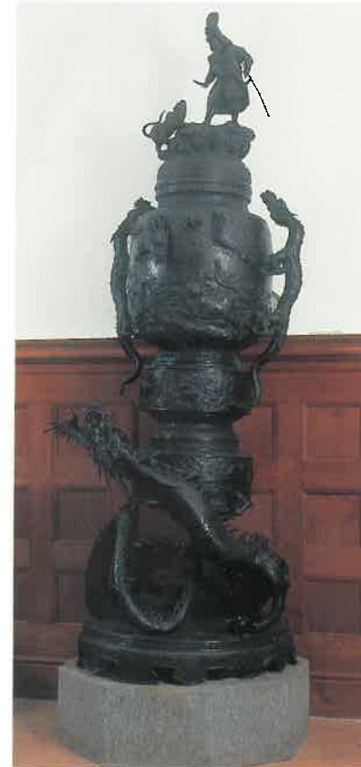
Antikt kinesisk bronzarbejde i søjlehallen