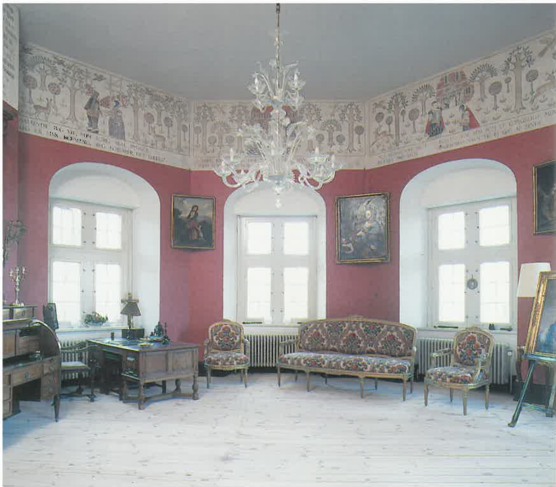
Tårnværelset, der også betegnes som spøgelsesværelse