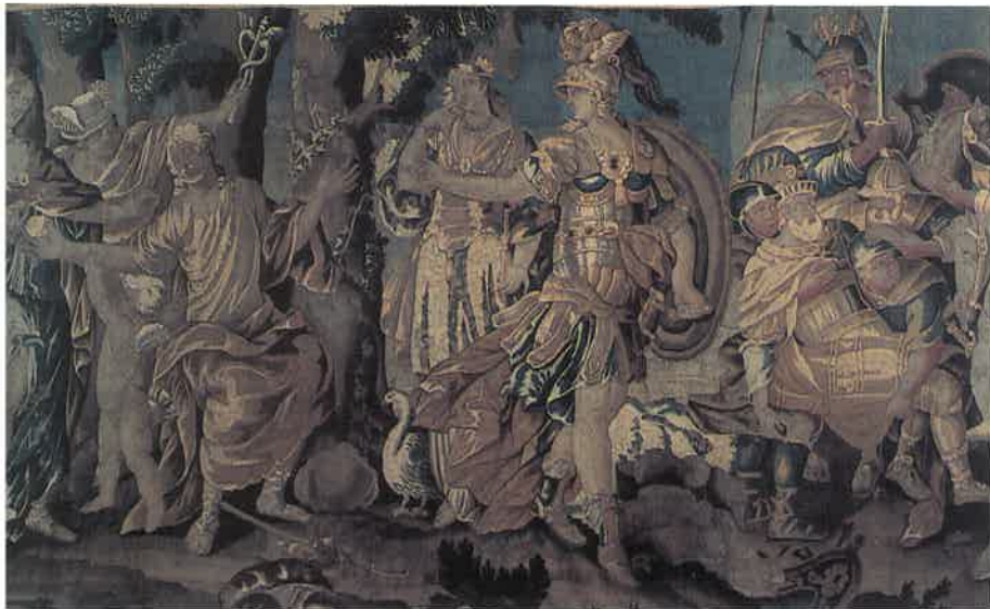
Flamsk gobelin i galleriet